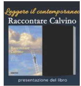
La locandina dell'evento

ITALO Calvino è stato un maestro indiscusso della narrazione e del gioco linguistico. Addentrarsi nella sua opera vuol dire riassaporare il fascino e la sfida di tante pagine del grande scrittore ligure che ha conquistato generazioni di lettori e studiosi. Lo fa in modo davvero sapiente un volume fresco di stampa, edito da Rubbettino, intitolato significativamente "Raccontare Calvino". Si tratta di un volume curato da Luigi Tassoni, Milly Curcio e Monica Fekete, che hanno coordinato un team di 14 studiosi europei, con loro impegnati a svelare, in modo originale, anche aspetti meno noti del mondo di Italo Calvino.